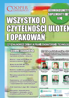
Wszystko o czytelności ulotek i opakowań czyli najnowsze zmiany w prawie i nowatorskie technologie