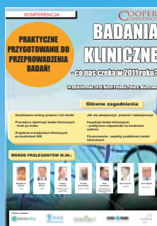
Badania Kliniczne - co nas czeka 2010 roku?